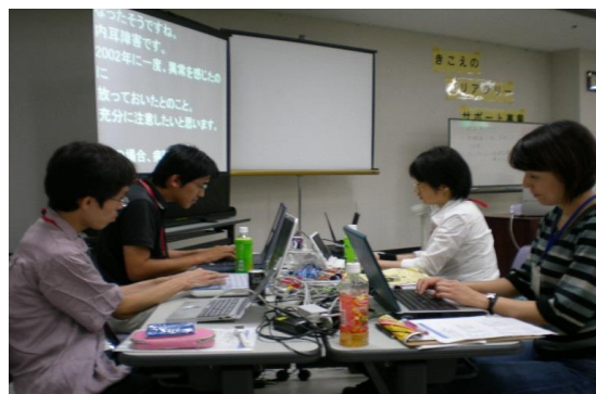
(パソコン要約筆記の様子)

要約筆記とは、 聞こえない・聞こえにくい方に その場の話を文字で伝える 「通訳」です。 私たちは、主にパソコンを使って 要約筆記をしています。