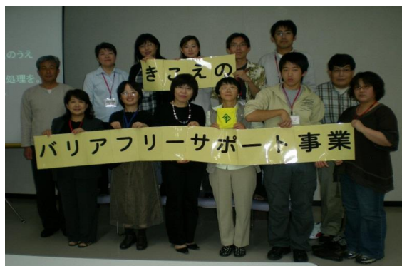
(聞こえに関する啓発活動)