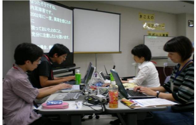
(パソコン要約筆記の様子)

要約筆記とは、 聞こえない・聞こえにくい方に その場の話を文字で伝える 「通訳」です。 私たちは、主にパソコンを使って 要約筆記をしています。