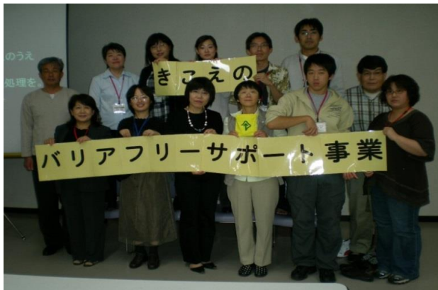
(聞こえに関する啓発活動)